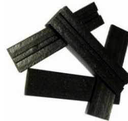
ADSEAL SETTING BLOCK CALES D'ASSISE