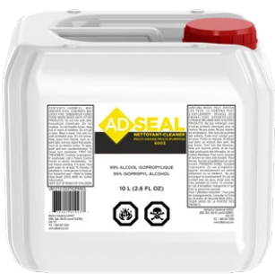
ADSEAL 6003 MULTI-PURPOSE CLEANER NETTOYANT MULTI-SURFACE