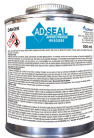
ADSEAL MK60095 PRIMER/APPRÊT