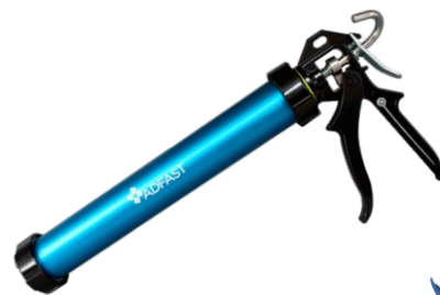
ADSEAL 600MG (600ml)